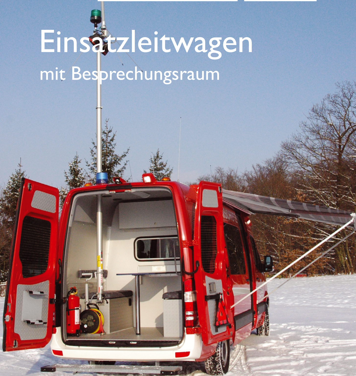
ELW UG-ÖEL bzw. UG San-EL